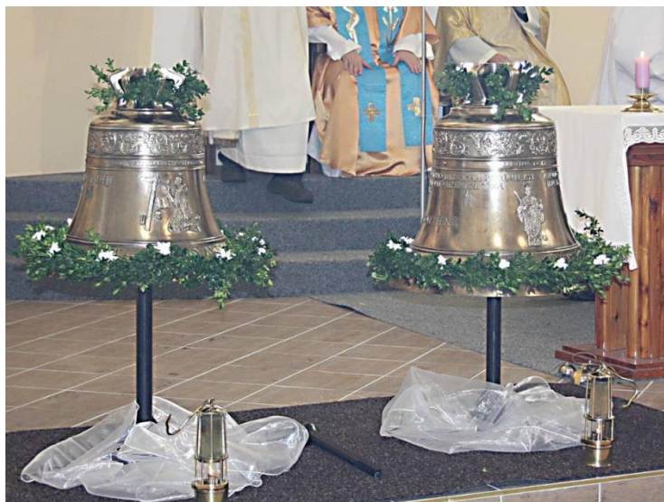
Dva nové kostelní zvony – Sv. Petr a Sv. Jindřich.