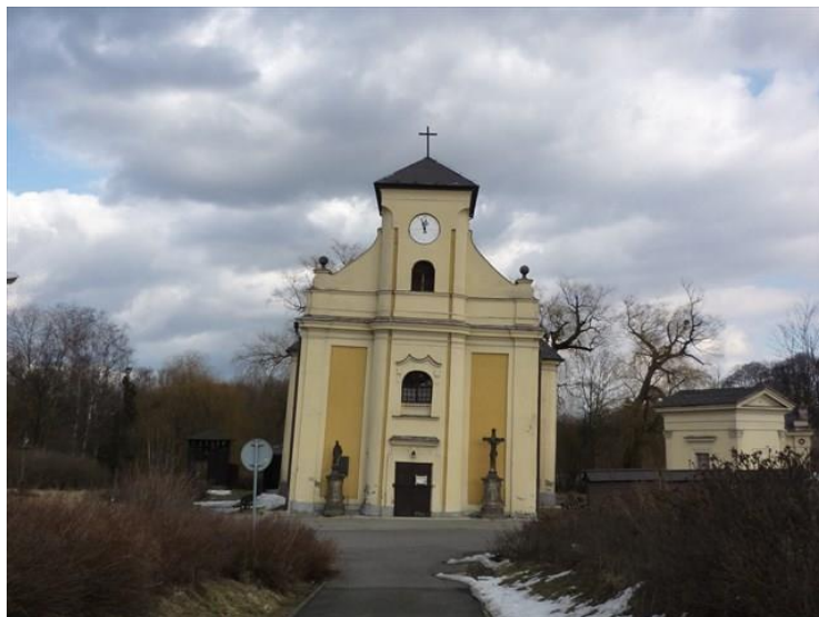
Kostel sv. Petra z Alkantary, po opravě v r. 1995

Když si porovnáte historické a současné fotografie kostela, všimnete si, že kostelní věž byla velmi citelně snížena. Důvod je prostý – nakloněná nízká věž tak snadno nespadne.