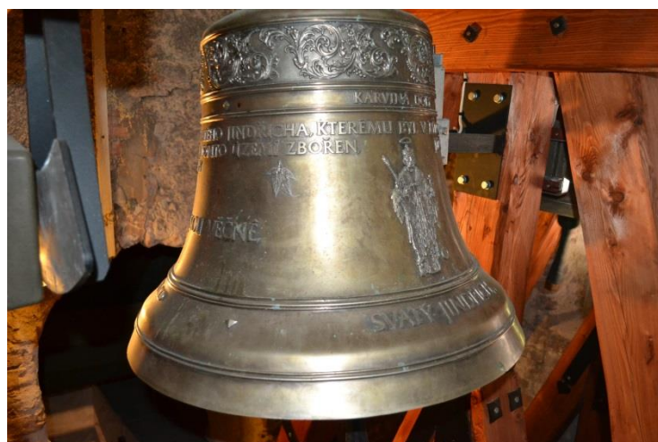
Sv. Jindřich zavěšený ve zvonici