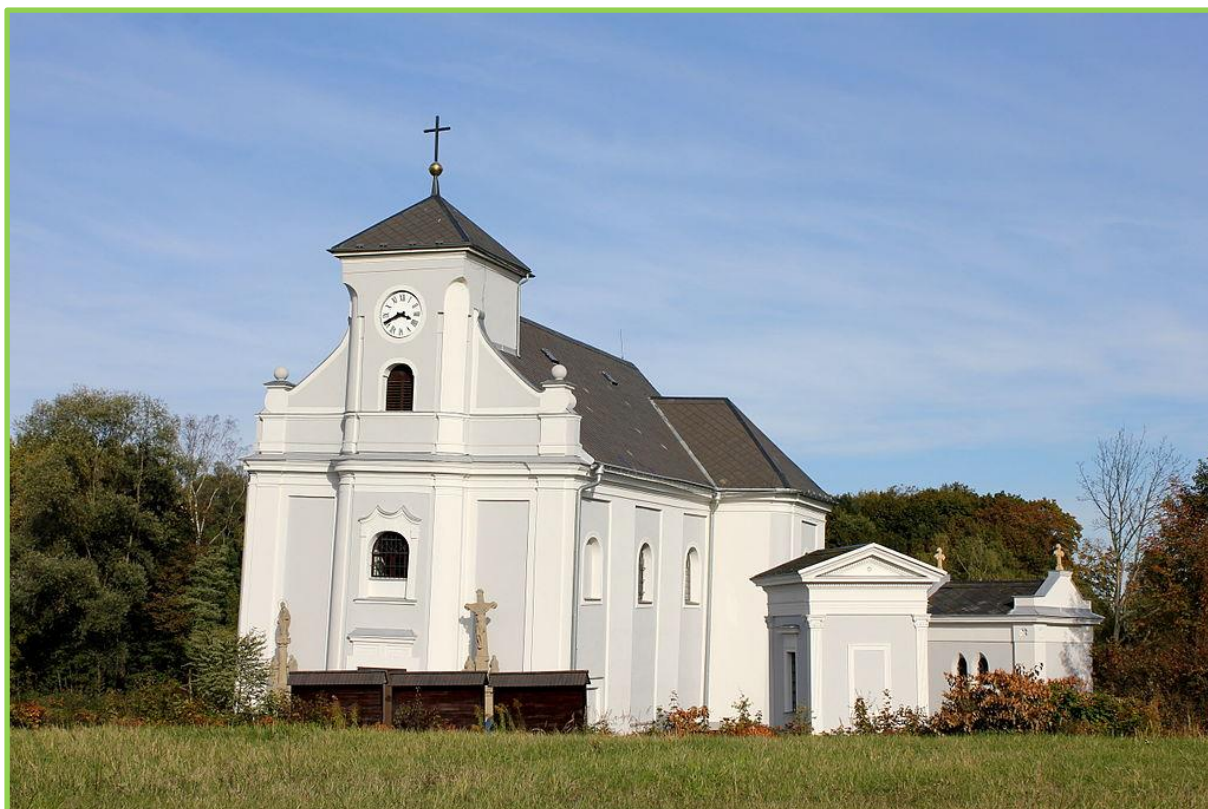
Kostel Sv. Petra z Alkantary (Karviná – Doly).

Informativní společensko – zábavný zpravodaj obyvatel a zaměstnanců Domova Vesna, p. o., Orlová