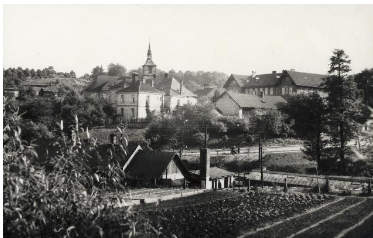
Kostel sv. Petra z Alkantary, 30. léta minulého století