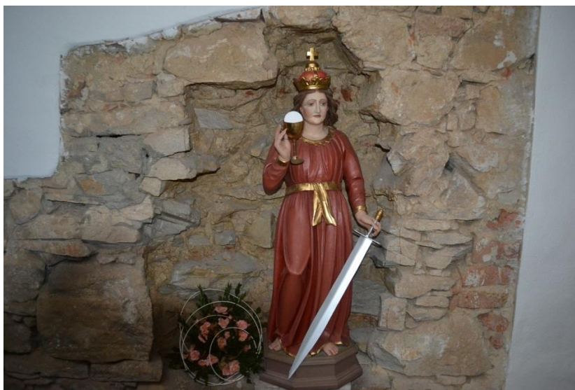
Svatá Barbora, patronka hornického stavu. Odkrytá zed' v pozadí ukazuje, proč kostel nespádl – je stavěn bez malty a stavební kameny se tak mohly „hýbat“ společně s upadáváním a nakláněním kostela.

V Německu, ve východním Frísku leží vesnice Suurhusen a tam mají taky kostel. Taky šikmý a o hodně starší než ten karvinský. Kostel v Suurhusenu pochází ze 13. století, jeho náklon je způsoben vlivem spodních vod a činí 5,19°. Němci se holedbají, že je šikmější než šikmá věž v Pise, a je tudíž nejšikmější na světě, což prý je podepřeno i zápisem v Guinnessově knize rekordů. No – my Karviňáci ale víme svoje!