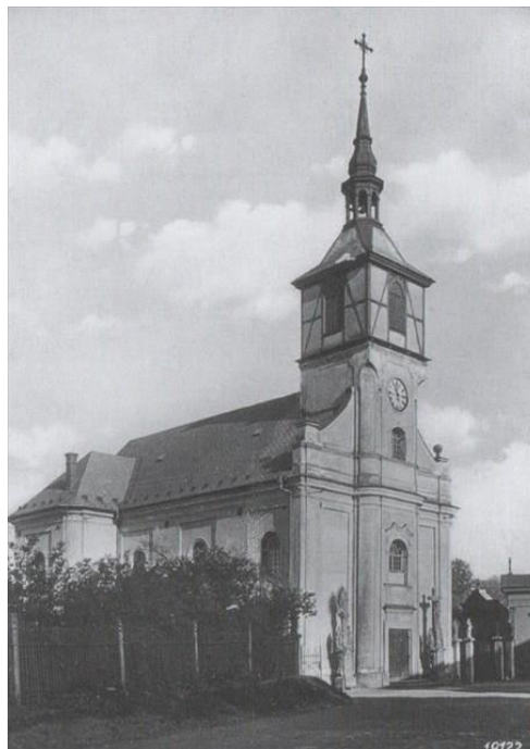
Kostel sv. Petra z Alkantary, pohled z počátku 20. století a z r. 1960