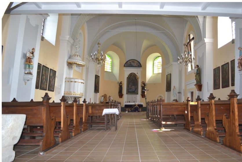
Interiér kostela v roce 2014